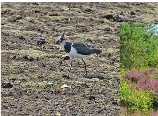
Kiebitz am Nulldamm