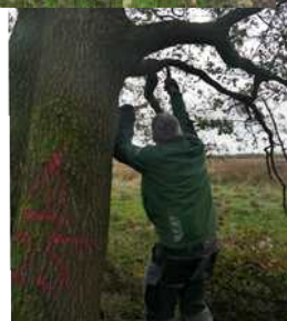
Gerd sorgt für freie Sicht !