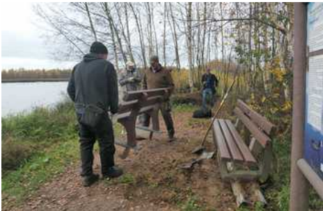
Das Ding ist schwer !