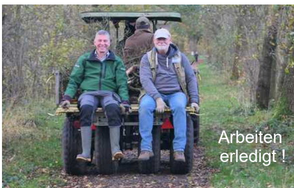
Arbeiten erledigt !