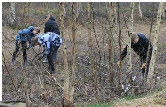
Fleißige Schüler !