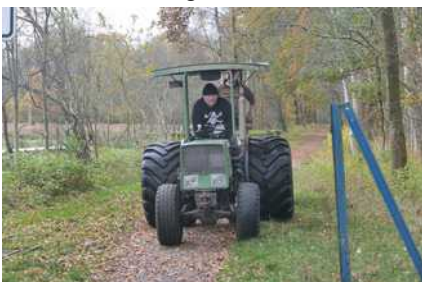
Vorsicht ! Nicht in den Graben !