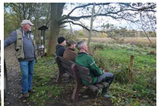
Aussicht auf das freie Feld !

Wir haben noch zwei Bänke die noch keine Spenderschilder haben, sprechen Sie uns an !