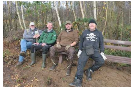
Eingebuddelt und für gut befunden !