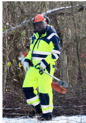
Stephan oder doch ein Alien ?