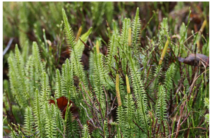
Der immergrüne Bärlapp