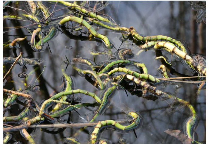
Die Wurzelstränge (Rhizome) der Sumpfkalla