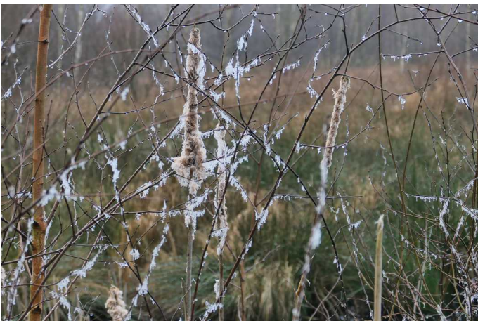
Frostige Rohrkolben am See

Hier noch ein paar zum Teil winterliche Impressionen von mir.