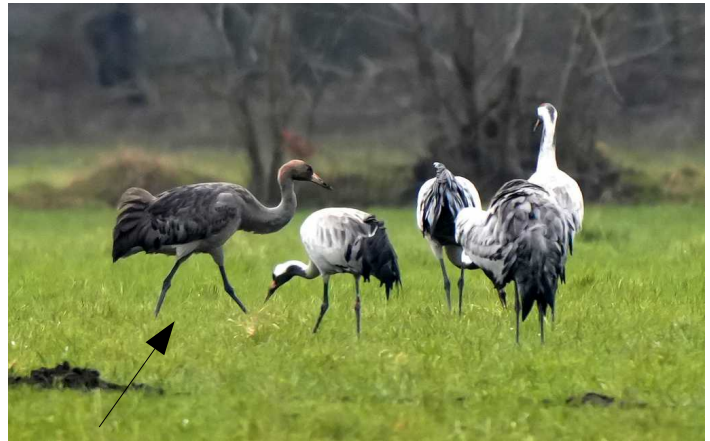
Der dunkle Kranich ist ein Jungtier aus dem letzten Jahr !