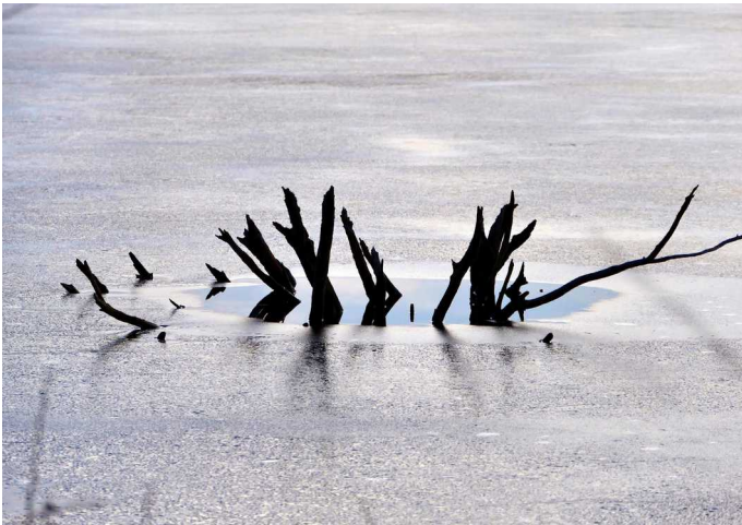
Eis auf dem See