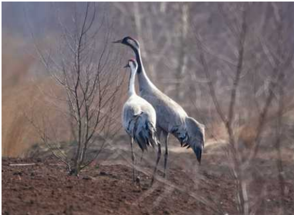
Kraniche und Seeadler im Moor !