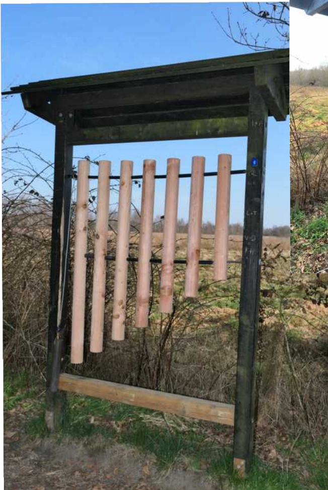
„Alle meine Entchen“ geht nicht ganz.....

Unsere Erlebnisstation mit den Klanghölzern war leider so nicht mehr tragbar und sicher auch eine Unfallgefahr! Das Holz war zu weich und splitterte immer mehr! Es wurden neue Hölzer bei einer Quickborner Tischlerei bestellt! Ebenso mußte der untere Querbalken erneuert werden! Leider war der Rahmen ein paar Wochen leer! Jetzt ist alles wieder zu benutzen und klingt gut!